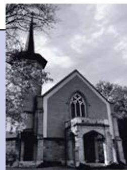
Temple de Versoix Route de Sauvigny 9