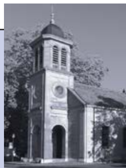
Temple du Petit-Saconnex Place du Petit-Saconnex 1