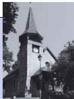
Chapelle des Crêts au Grand-Saconnex Ch. des Crêts-de-Pregny 11