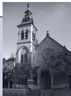
Temple de Genthod Route de Rennex 2