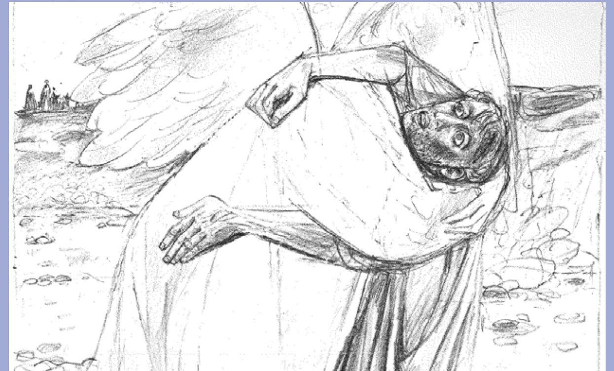
Jacob au Yabboq, lithographie de Felix Hoffmann tirée de «Bilderbibel» Zwingli Verlag 1961

JAB CH-1218 Le Grand-Saconnex P.P. / Journal