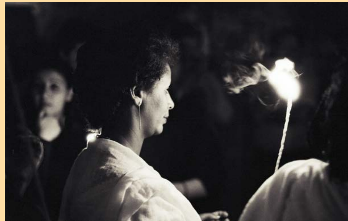
«A la recherche du Christ ressuscité» ... célébration de la nuit de Pâques au monastère éthiopien 'Deir es-Sultan' qui se trouve sur le toit du Saint-Sépulcre à Jérusalem (Pâques 1985)

Région Jura-Lac Paroisse des 5 communes : Genthod | Bellevue Collex-Bossy | Pregny-Chambésy | Grand-Saconnex