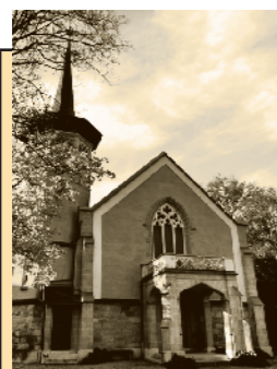
Temple de Versoix Route de Sauverny 9