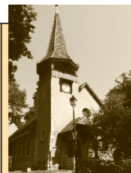
Chapelle des Crêts au Grand-Saconnex Ch. des Crêts-de-Pregny 11