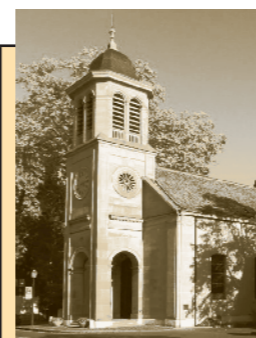
Temple du Petit-Saconnex Place du Pt-Saconnex 1