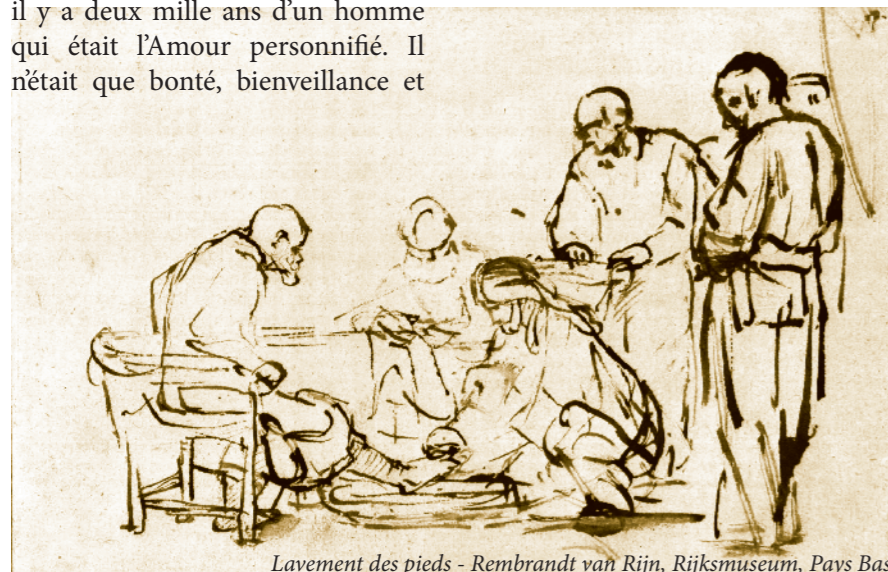
Lavement des pieds - Rembrandt van Rijn, Rijksmuseum, Pays Bas

Pour faire un don ... en vous remerciant très chaleureusement d'avance !