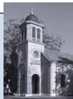
Temple du Petit-Saconnex Place du Pt-Saconnex 1