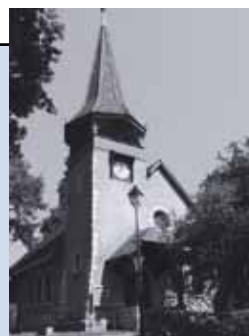
Chapelle des Crêts au Grand-Saconnex Ch. des Crêts-de-Pregny 11