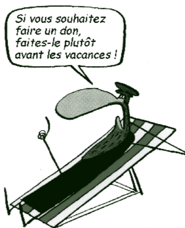
Dessin repris avec l'aimable autorisation de l'auteur Mix & Remix : « Calvin sans trop se fatiguer!... »