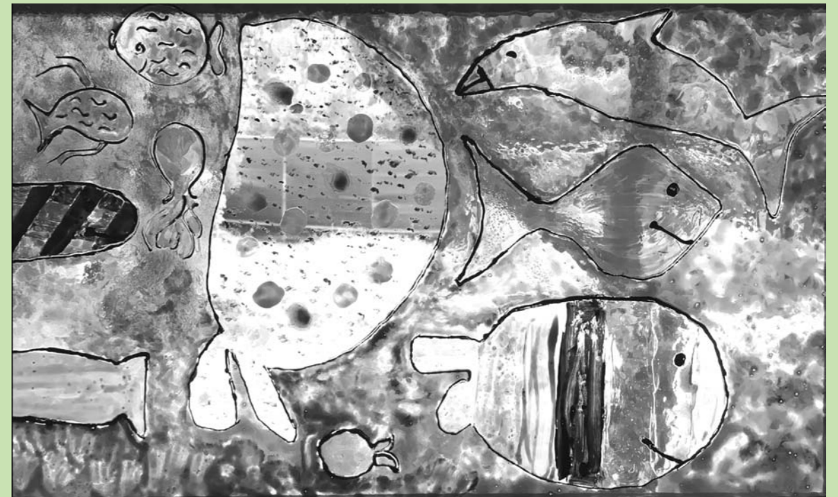
« La pêche miraculeuse » Détail d'un vitrail réalisé lors de la 'journée famille' le jour de l'Ascension 2019 aux Crêts

Région Jura-Lac Versoix | Genthod | Bellevue | Collex-Bossy Pregny-Chambésy | Grand-Saconnex | Petit-Saconnex