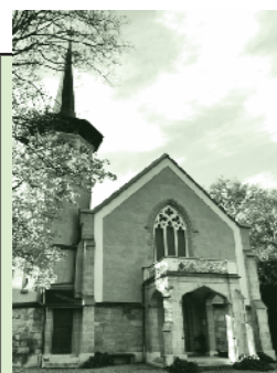
Temple de Versoix Route de Sauverny 9

! Attention aux horaires de cultes pendant les deux mois de vacances !