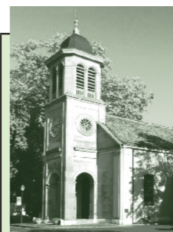
Temple du Petit-Saconnex Place du Pt-Saconnex 1