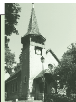
Chapelle des Crêts au Grand-Saconnex Ch. des Crêts-de-Pregny 11