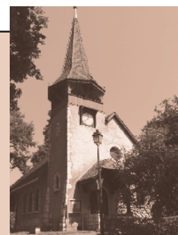
Chapelle des Crêts au Grand-Saconnex Ch. des Crêts-de-Pregny 11