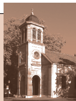
Temple du Petit-Saconnex Place du Pt-Saconnex 1