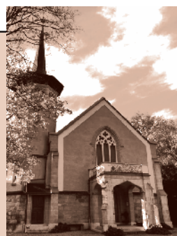
Temple de Versoix Route de Sauvigny 9