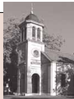
Temple du Petit-Saconnex Place du Pt-Saconnex 1