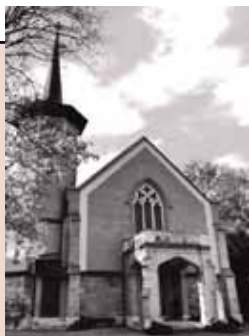
Temple de Versoix Route de Sauverny 9