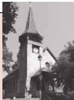
Chapelle des Crêts au Grand-Saconnex Ch. des Crêts-de-Pregny 11