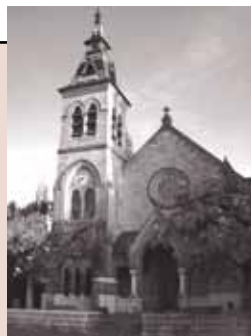
Temple de Genthod Route de Rennex 2