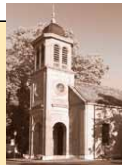
Temple du Petit-Saconnex Place du Pt-Saconnex 1