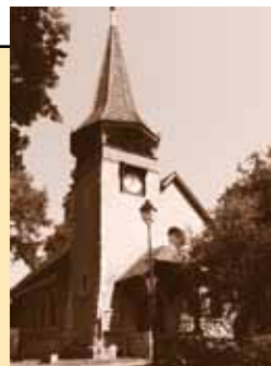
Chapelle des Crêts au Grand-Saconnex Ch. des Crêts-de-Pregny 11