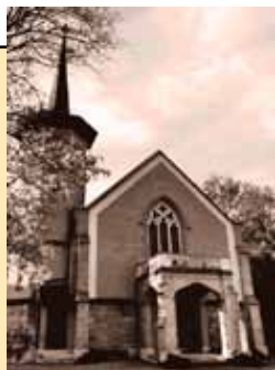
Temple de Versoix Route de Sauverny 9