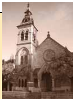
Temple de Genthod Route de Rennex 2