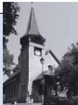
Chapelle des Crêts au Grand-Saconnex Ch. des Crêts-de-Pregny 11