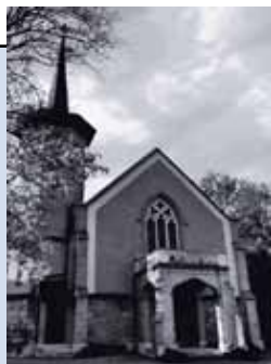
Temple de Versoix Route de Sauverny 9