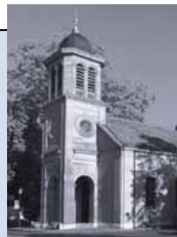
Temple du Petit-Saconnex Place du Pt-Saconnex 1