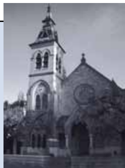
Temple de Genthod Route de Rennex 2