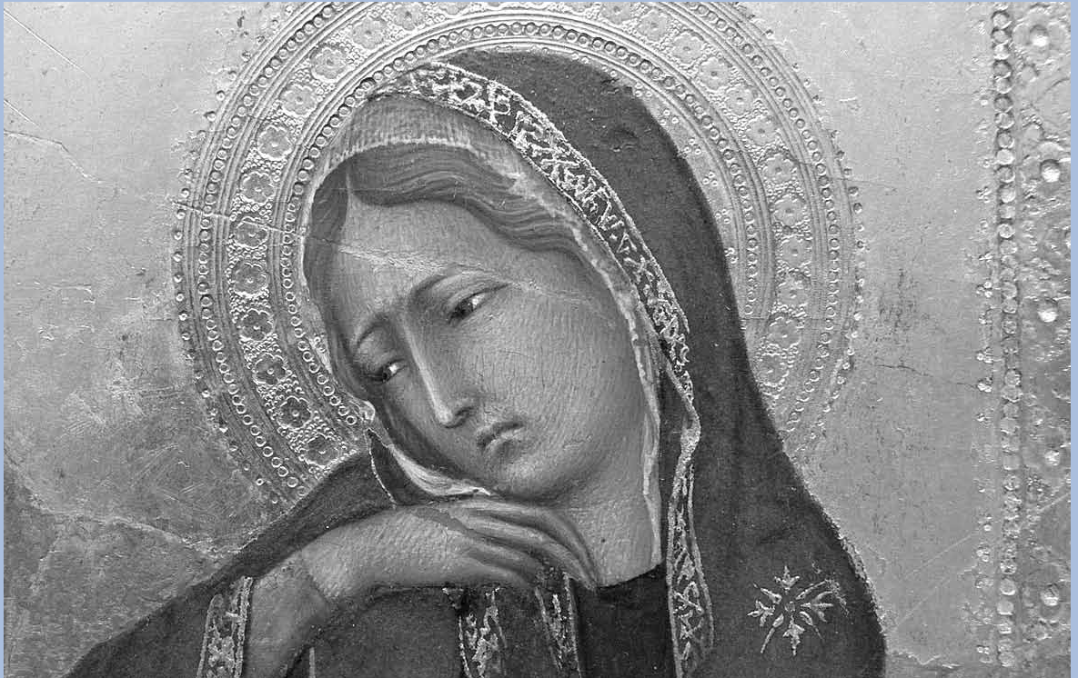
Simone Martini, détail de L'Annonciation , tempera sur bois, Musée royal des Beaux-Arts d'Anvers.